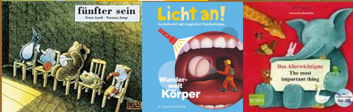
Buchideen (über Rucksack ausleihbar)