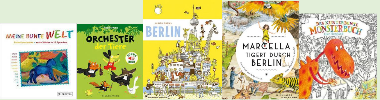
Bücher; Das Kunterbunte Monsterbuch: v.a. einzelne Seiten kopieren für Ausmalvorlagen!